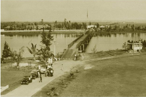
Cầu Hiền Lương, sông Bến Hải, Vĩ tuyến 17