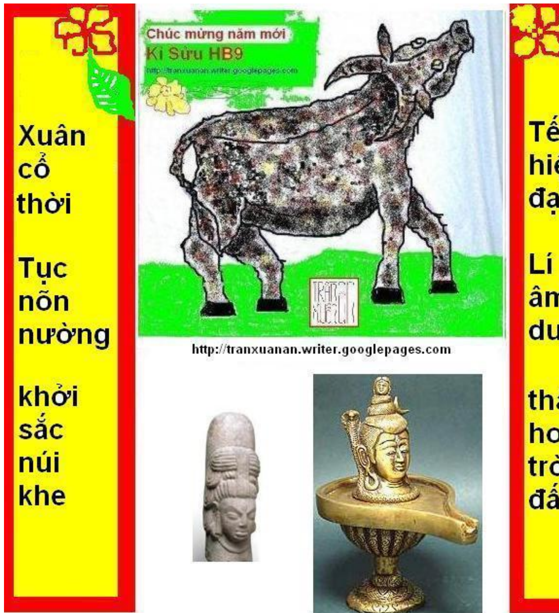
Thần Hủy diệt và Sáng tạo Shiva -- Mukhalinga (Shiva trên Nón & Nường) THÂN SINH THỰC KHÍ: NGUYỄN LÍ ÂM -- DƯƠNG VỚI CÁI NHÌN TÈ VẬT (MỌI BỘ PHẬN, MỌI SỰ VẬT, HIỆN TƯỢNG ĐỀU BÌNH ĐẲNG)

Xin lưu ý: "Tục" bao gồm hành vi cụ thể; "Ý" chỉ ý niệm trừu tượng hóa trong tư duy (29-12 áp Tết Kỉ Sửu HB9)