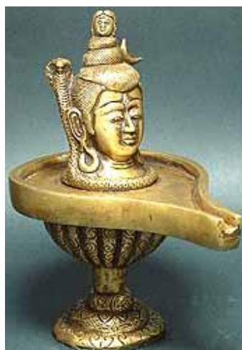
Ảnh chụp Mukhalinga